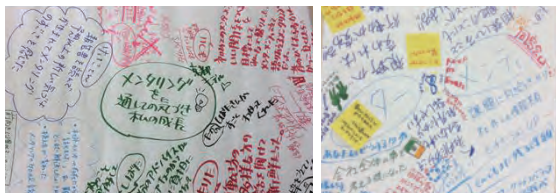
参加することで、新たな視点が生まれます！

3回のメンタリングを振り返って、ペア以外のメンター、メンティの話を聞く機会を持ちました。金言、名言が数多く飛び出し、学び深いひと時でした。ぜひ、来年も！の声多数。「参加したからこそ、この良さを他の方にも伝えていきたい！」と思います。