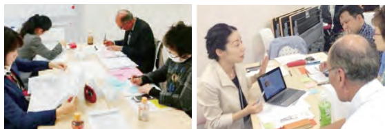
パート社員の戦力化ラボの様子

などをヒアリングした結果、現状では「短時間正社員制度」を取り入れるのは難しいと考えますが、制度は整えておいて、時期が来たときに取り入れたいと思っています。また、「短時間正社員制度」以外でパート社員の方々に活躍していただくためのアイデアなども提供いただき、今後のパート社員の戦力化に活かして行ければと考えています。