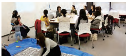
学びの多い時間になりました