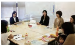
メンターにも気づきが

メンティの課題を何とか解決してあげたいと思うメンターでしたが、メンタリングでは答えを教えるのではなく、自ら答えに至る手助けを行うべきである、と認識しました。