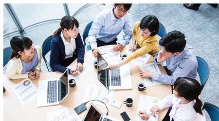
プロジェクトチーム